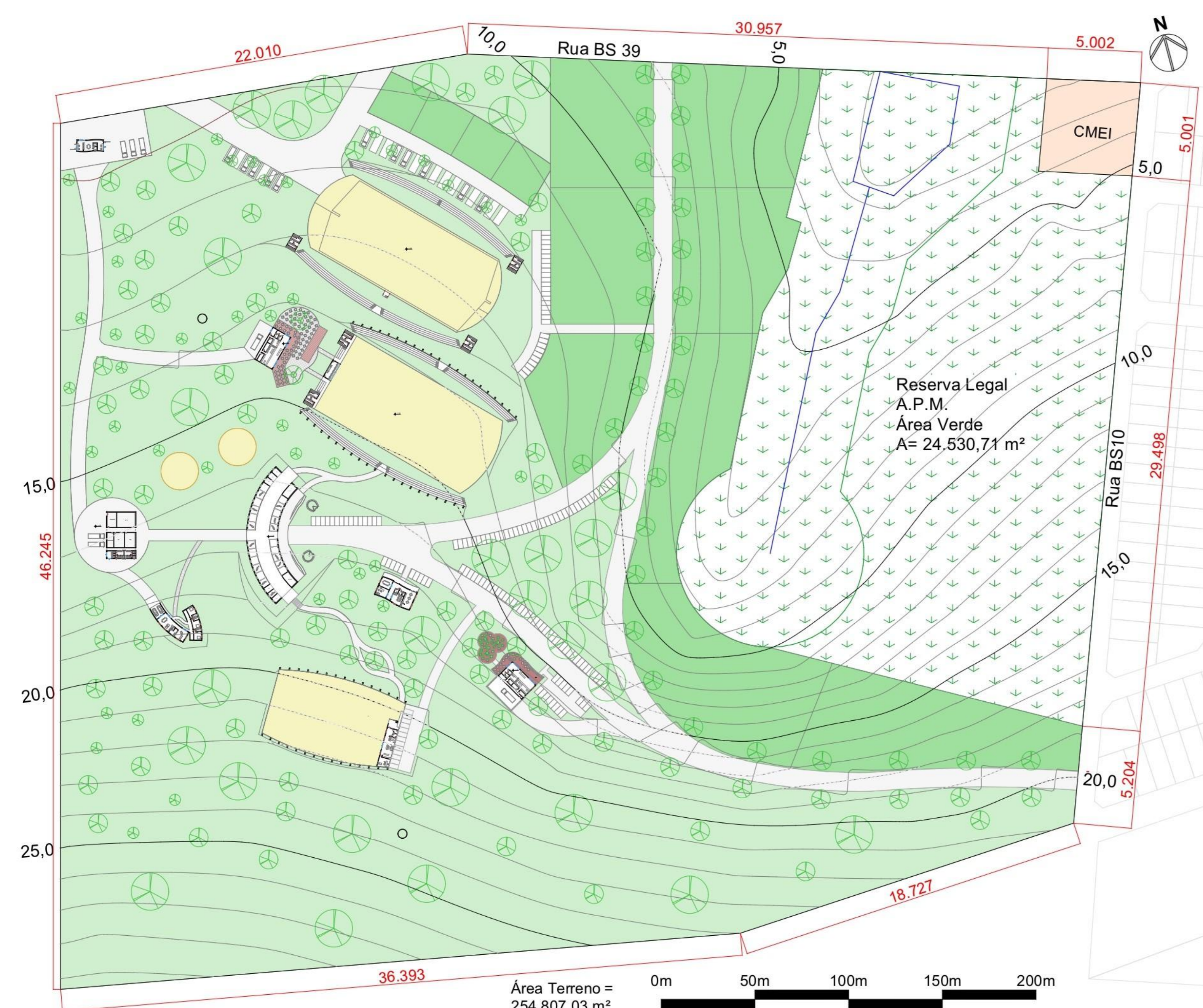
Planta Pav. Térreo e Locação 1:2000

O centro conta com uma área verde permeável extensa, onde será permitido o livre trânsito de pessoas e animais, os passeios à cavalo são permitidos por toda a área do centro, onde serão espalhadas vegetações para maior conforto, experiência e contato com a natureza. As áreas verdes também serão utilizadas para os tratamentos da equoterapia, estimulando os pacientes em diferentes áreas, com diferentes inclinações e percepções do meio.