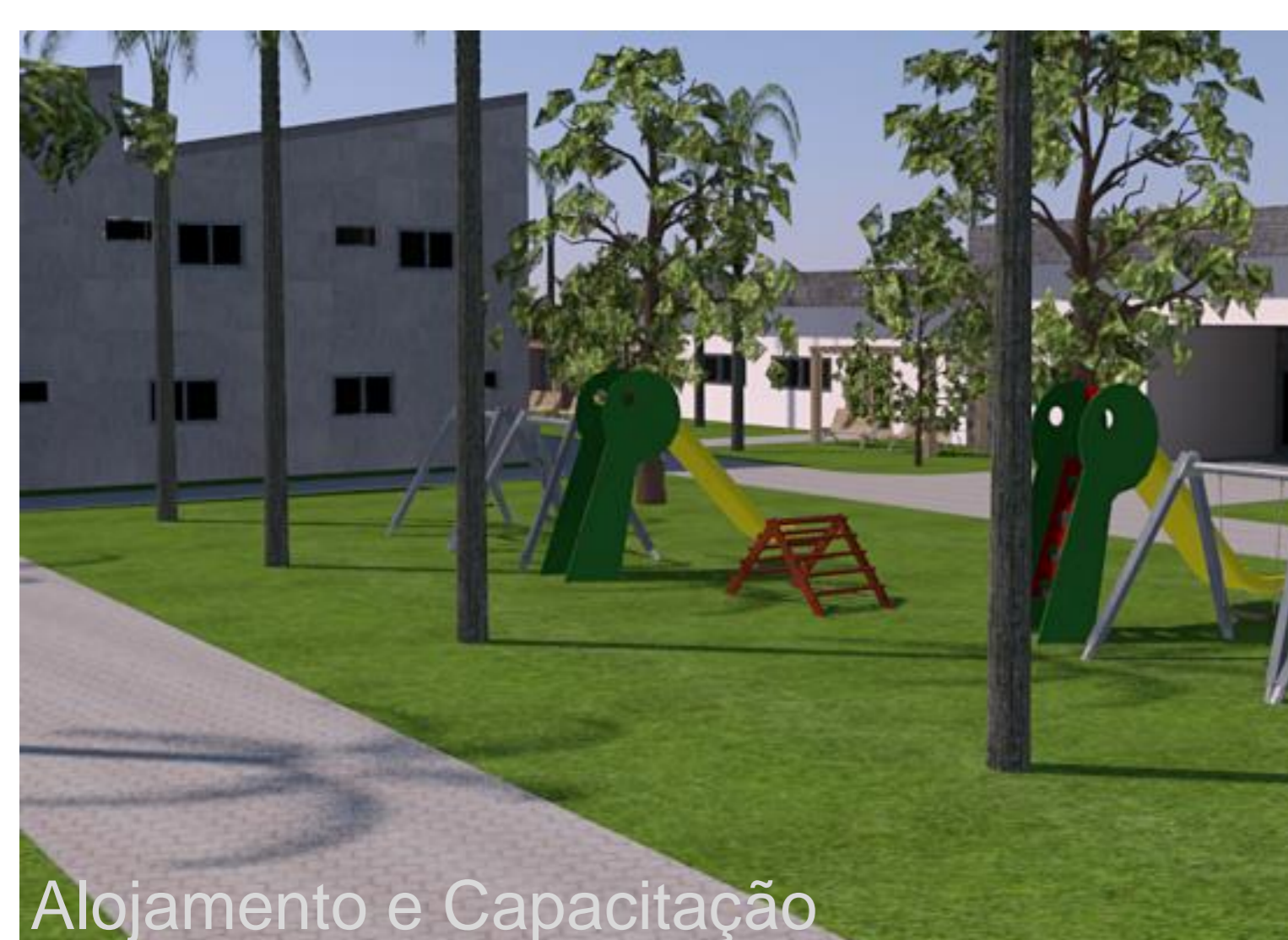
Alojamento e Capacitação