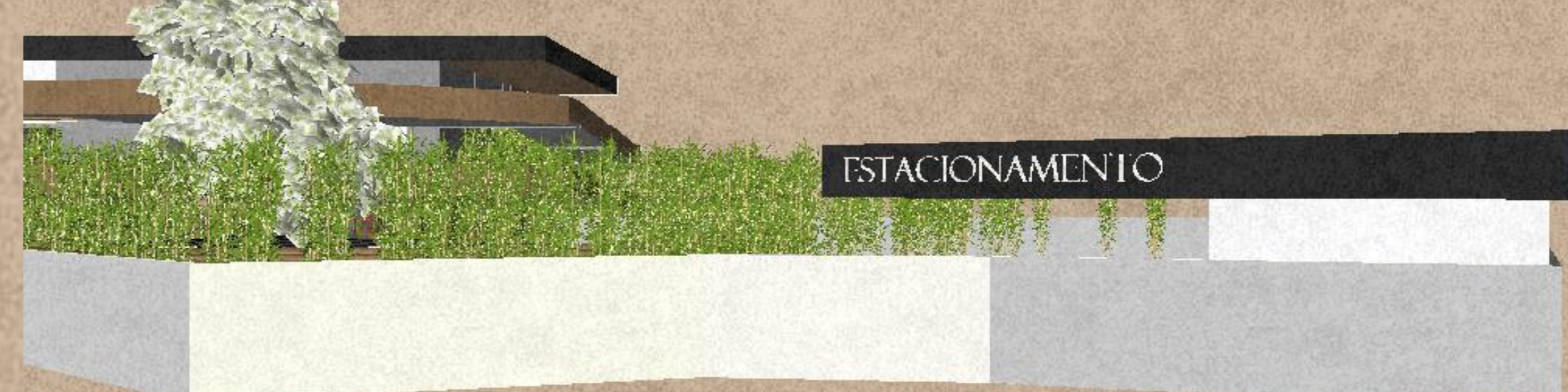
Figura 5: Fachada Sul