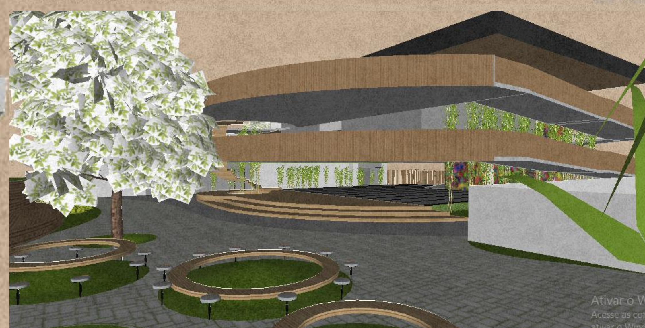
Figura 7: Área de convivência