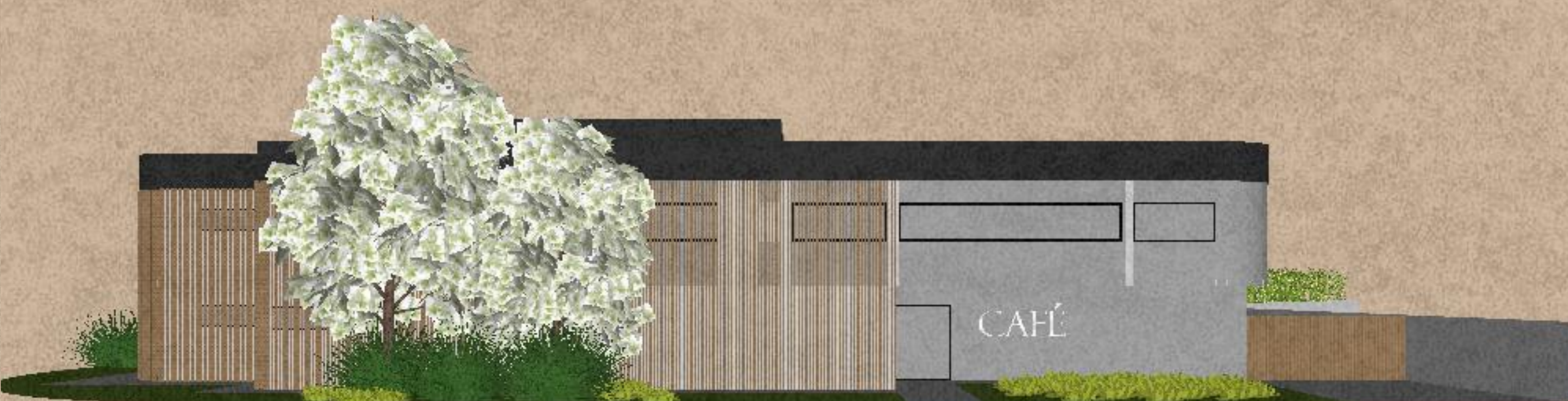
Figura 3: Fachada leste