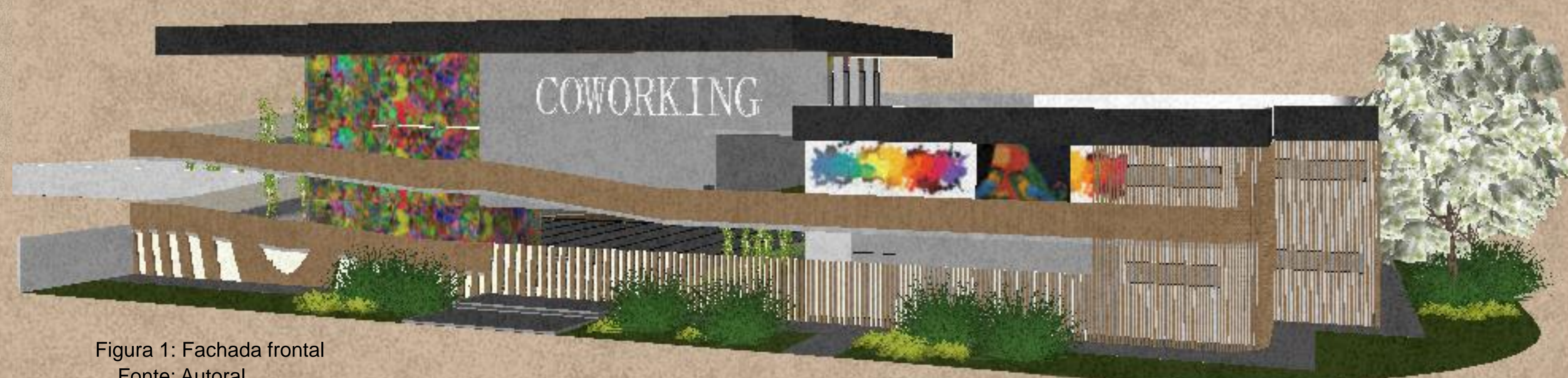
Figura 1: Fachada frontal