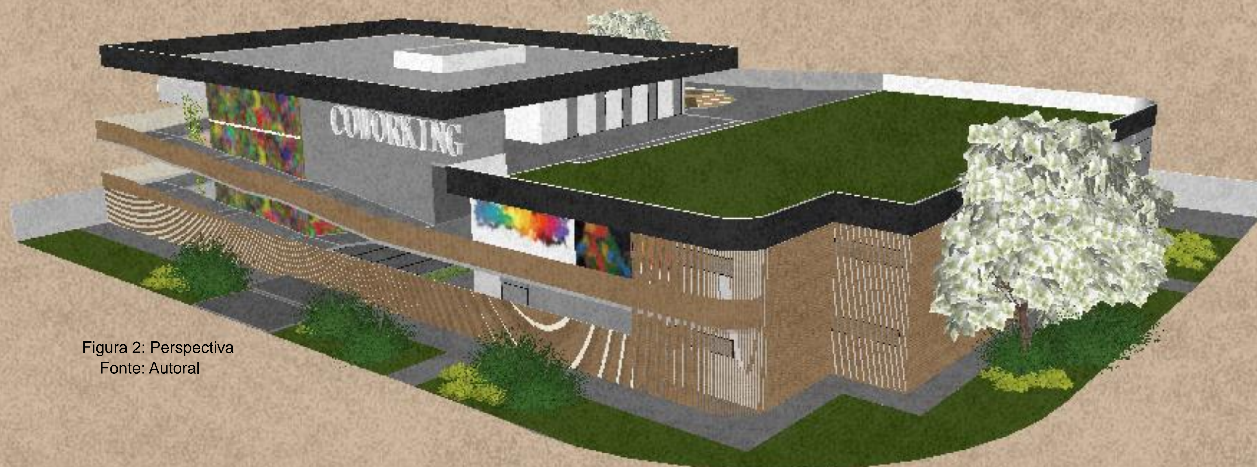
Figura 2: Perspectiva