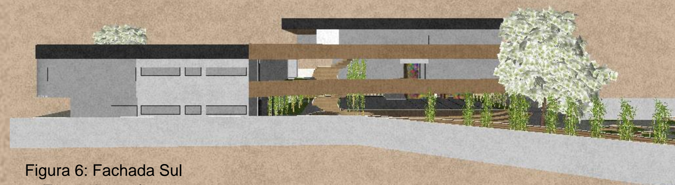
Figura 6: Fachada Sul