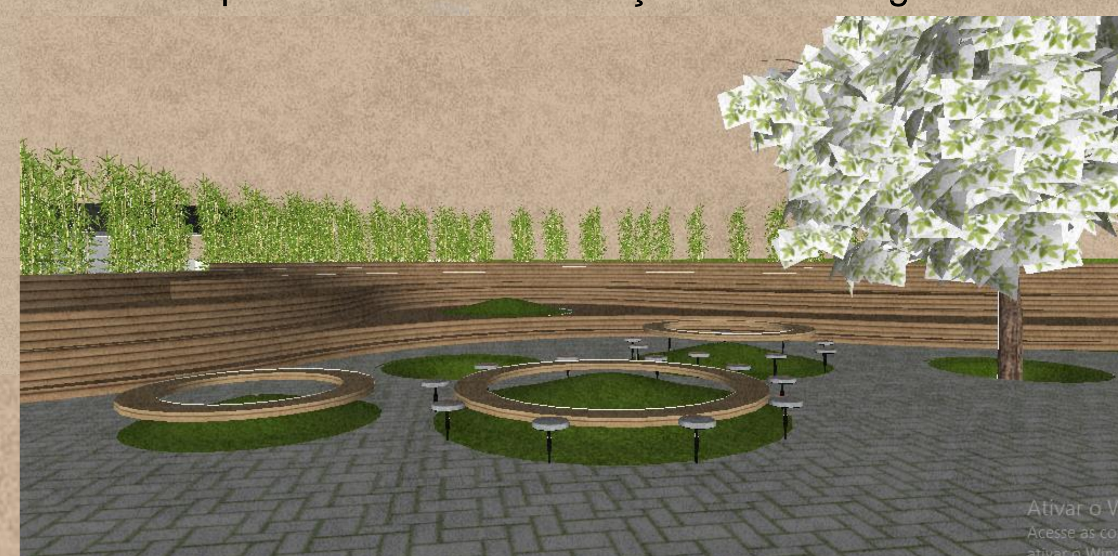
Figura 4: Área de convivência